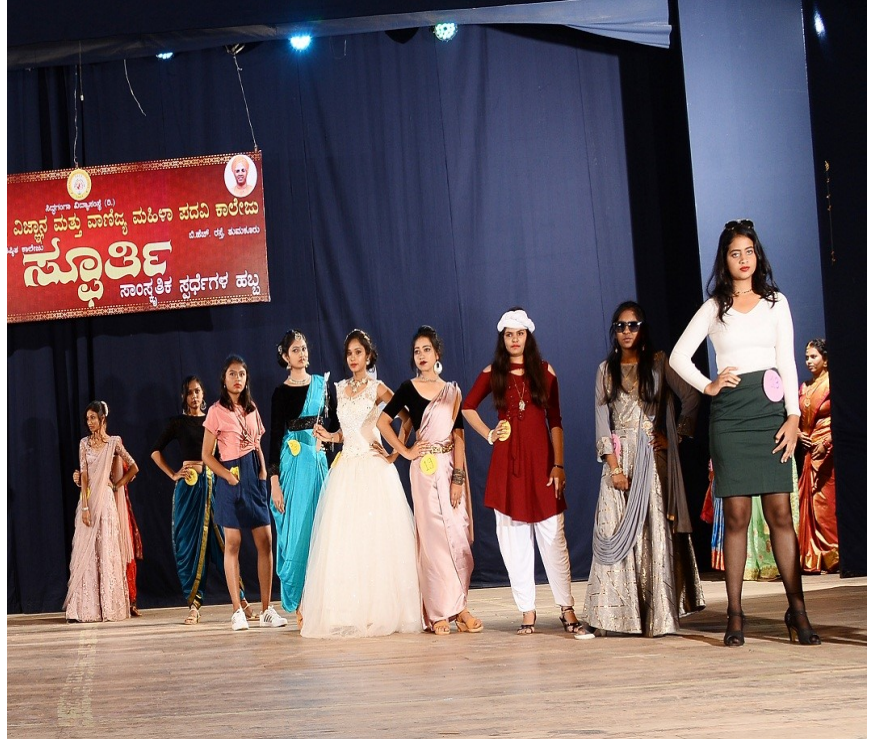
Fashion show-1. Traditional Round 2. Modern round