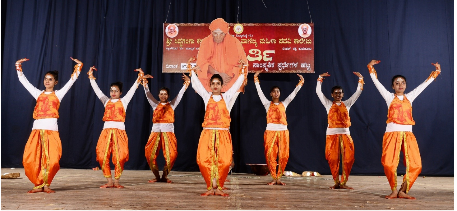
Kannada and Hindi Modern Dance